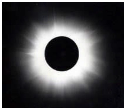
9. kép. Napfogyatkozás.

A felemelő értelem és az életfakasztó Nap párhuzamából adódott, hogy az értelemnek ugyanúgy egységes világgá kell szerveznie az emberiséget, ahogy az éber tudat fénye egységes tudatállapottá szervezi éber tudatunkat, és ahogy a Nap fénye egységes világgá szervezi a nappalt. Ebből pedig több következtetés is adódik. Először is: az emberiség első államalkotó népe a Napvallású hun-magyar nép. Másodsor: az első állam szükségképpen királyság kellett legyen, hiszen a királyság eszméje által jöhetett létre. Harmadszor: az első királyságnak Napkirályságnak kellett lennie, mert a Nap életadó, felemelő megnyilvánulásainak megértése alapján jött létre (GKE-GA, 2006, 82-98). Negyedszer: a Napkirályok felségjelvénye a Napból kell eredjen. Egyetlen létező rendelkezik az ember számára látható koronával: a Nap. A Nap koronája természetes felségjelvény.