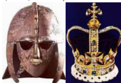
13. kép. Az angol korona fejlődése a 9. századi angolszász koronától a 17. századi Szent Edward koronájáig. Nemcsak a két keresztpánt, hanem az országalma és a kereszt is rákerült.

A hun-magyar királyok a Napisten földi kép-viselői voltak. A koronázási jelvények, a korona, a jogar, a palást, a gömb, a trónszék mind a Nap-képzetekkel függnek össze és a Napistenre vezethetők vissza. Maga a koronázás sem más őseredeti értelmében, mint szent aranykörrel való felékesítés, a Naptól született gyermekké való felavatás. Maga a 'király' szó is, miként a szótó mutatja, éppúgy, mint 'korona' szavunk töve, 'kör' összavunkat rejt, s az égi szent körre, a Napra, a Napistenre utal, arra, hogy mindezek a szertartások az ősi Napistenhit keretébe tartoznak és a Napisten képmásává történő felavatást jelzik. Mindezek ma is élő magyar összavak. Az ősfogalmaknak, a koronázás tárgyi jelképeinek, szertartásainak ősforrása a szkíta-hun magyarság. A koronázási fogalmak és szertartások innen terjedtek el világszerte, tőlünk vette át azt a világ valamennyi népe, anélkül, hogy ismerné e szavak, jelvények őserelmét (GKE, 1996b).