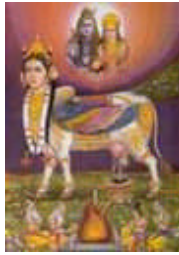
3. kép. A táltos-szárnyas, szent tehén, Kamadhenu.

Értelmezésünkéből következik, hogy a Világegyetemet és a Napot vágyaink teljesítőiként fogták fel eleink. A mai indiai „szent tehén” kultusz tehát az indiai hunok eredetmondájának tiszteletéből fakad. Ha a Napot és a Világegyetemet a bennük megnyilvánuló kozmikus alkotóerő, életerő megnyilvánulásának tekintjük, felismerhetjük őseink eredetmondájának igazát. Valóban, az emberiség mindent a benne rejlő, láthatatlan alkotóerőnek köszönhet. Az emberiség lényege ugyanúgy a láthatatlan alkotóerő, mint a magé, és az Élő Világegyetemé.