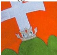
11. kép. Jól látható a királyi korona három csúcsos ága.

A korona mindhárom ága a csúcsánál továbbágazik, ismét háromfelé. Így fogja össze a korona egyetlen egységes egészzé a hármas háromságot.