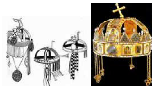
12. kép. Keresztpántos koronák az észak-eurázsiai síkságról. Ma a sámánok viselik, a királyi mágusok kultúrájának morzsáit őrizve (GA, 2006, 194-212). Mellette a keresztpántos magyar Szent Korona.