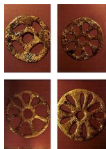
7. kép. Elefántcsont Napkorongok a sungiri sírból

A sungiri férfin 2936 finoman megmunkált mamutagyar gyöngyöt találtak, ezek jó része fonalakra felfűzve, a homlok körül körbefutva fejpántot alkot. Úgy tűnik, a fejpánt mellett a magyar Szent Korona alapszerkezetéhez hasonló keresztpántos korona egyik keresztpántja viszonylag épen, a másik csak nyomokban maradt meg. Mellette súlyos, húsz kilogrammos, megpuhított és kiegyenesített, majdnem két és fél méteres mamutagyar vezéri pálca, illetve királyi jogar. A masszív mamutagyar kiegyenesítése fejlett technológiát igényelt, máig nem sikerült megfejteni, miféle kémiai eljárással voltak erre képesek. Vadászfegyver (lándzsa) már csak azért sem lehetett, mert ehhez túl súlyos volt (Rudgley, 2002, 220.), s ez megerősíti, hogy felségjelvény, királyi jogar lehetett. A sírban talált, mamutagyarból készült Nap-korongokon a belső és külső kör közötti gyűrű nyolcas tagolású.